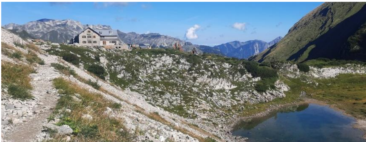
Ein Karsee liegt ganz in der Nähe beim Prinz Luitpold-Haus.

13:30 Uhr bis 15 Uhr: Aufstieg zum bewirtschafteten Prinz Luitpold-Haus (Höhe: 1.846 m)