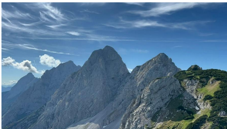
Blick vom Raintaler Joch auf die Tannheimer Gruppe: Gehrenspitze, Köllespitze, Gimpel, Rote Flüh, Schartschrofen (v.l.n.r.)

Von der Talstation der Bergbahn (Sonnenbergbahnen Grän-Füssener Jöchle, Füssener Jöchle Str. 8, A-6673 Grän) im tirolischen Grän aus fahren wir hoch zur Bergstation Sonnenalm. Von dort aus wandern wir über das Raintaler Joch, dann vorbei an der Läufer Spitze und hierauf über das Hallergen Joch bis schließlich zum Gipfelkreuz des Schartschrofens. Nachdem wir dort die Aussicht genossen haben, kehren wir zurück zum Hallergen Joch und steigen von hier vorbei an der Gessenwangelpe zur bewirtschafteten Adlerhorst-Berghütte ab. Anschließend wandern wir zurück in Richtung Grän zur Bergbahn-Talstation, dem Ausgangspunkt unserer Tour.