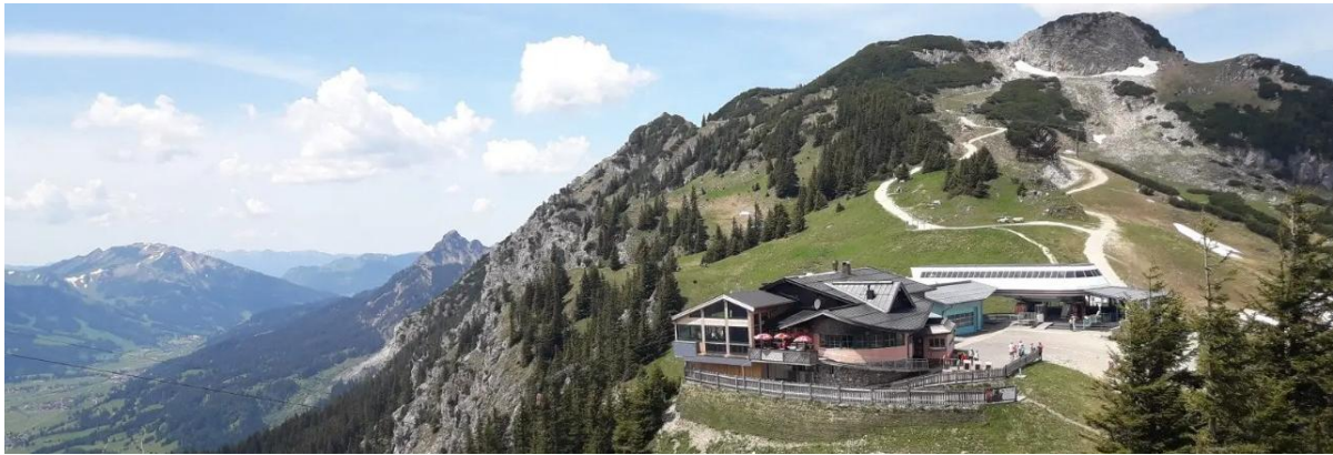
Die Sonnenalm auf dem Füssener Jöchle mit der Bergbahn-Bergstation dahinter

11:00 Uhr bis 12:00 Uhr: Gleich neben der Bergstation befindet sich die bewirtschaftete Sonnenalm (Höhe 1.821 m). Hier können wir Mittag machen und nebenher Aussicht genießen: