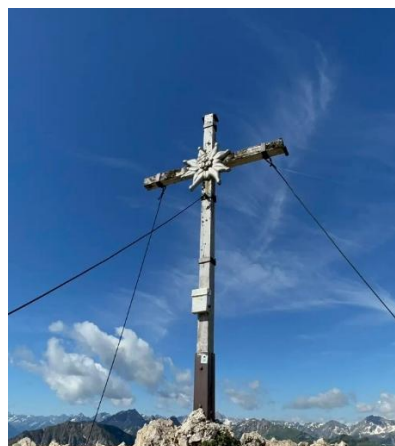
Gipfelkreuz des Schartschrofens