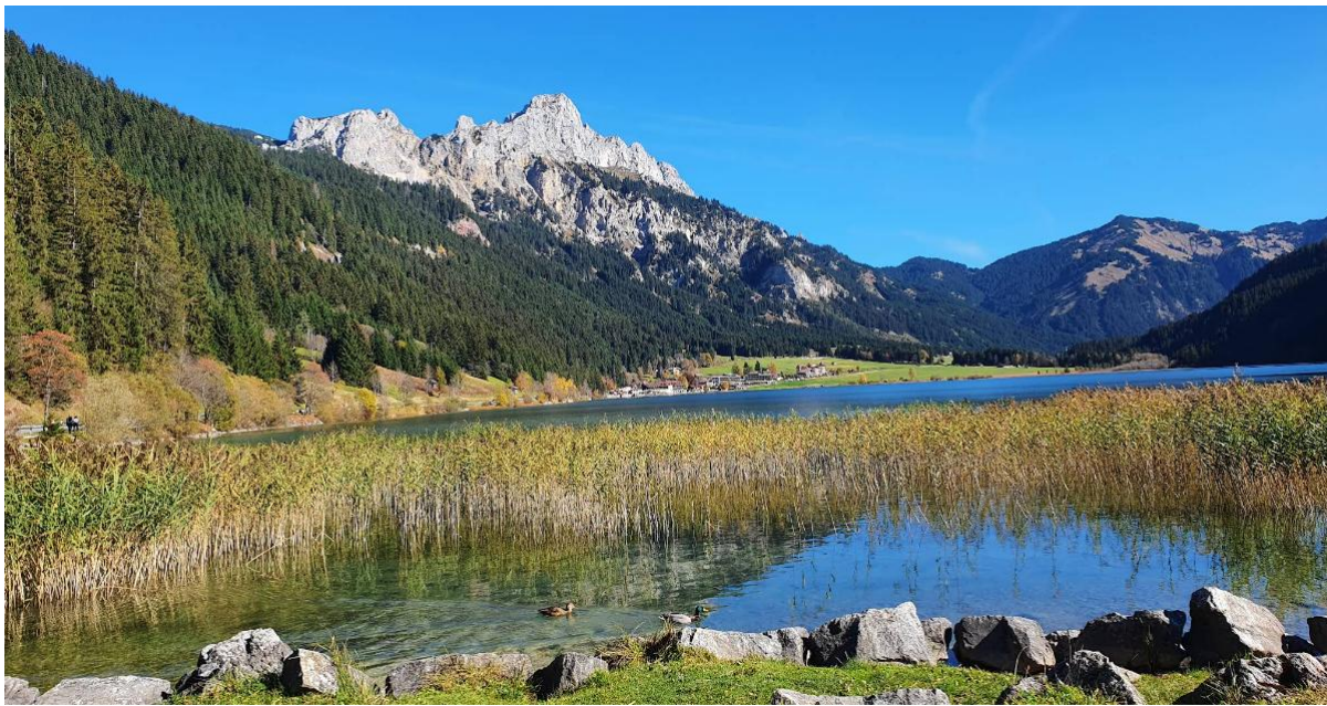
Blick auf den Haldensee vom Parkplatz aus mit Läufer Spitze, Schartschrofen, Roter Flüh und Hahnenkamm im Hintergrund.

10:45 Uhr bis 11:00 Uhr: Zusammenkunft am Haldensee-Parkplatz an der Westspitze des Haldensees neben der B199 (Kosten für 4 Stunden Parken: 3 €).