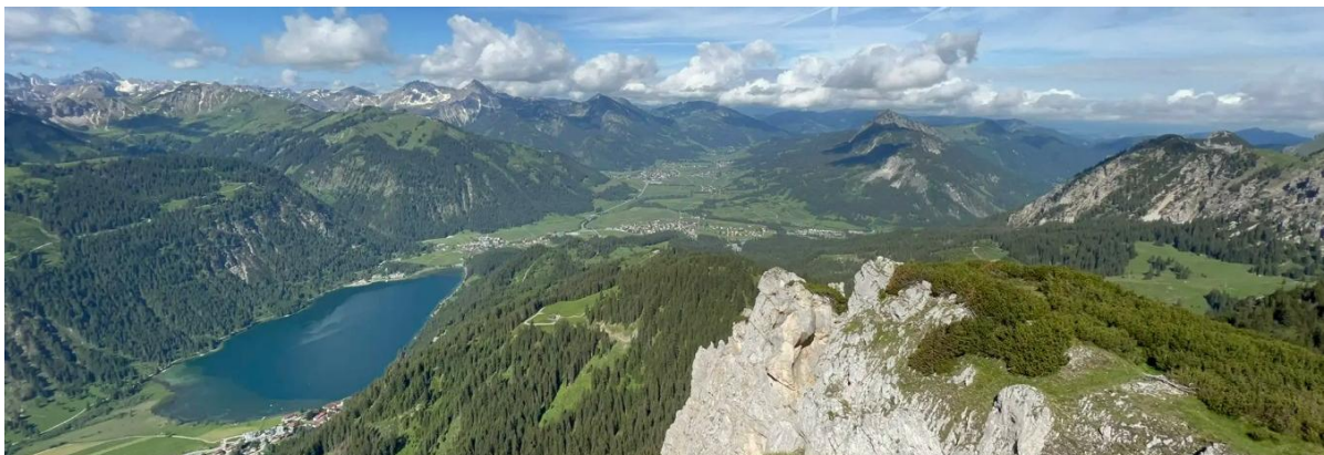
Blick vom Schartschrofen auf den Haldensee und das Tannheimer Tal

12:00 Uhr bis 13:30 Uhr: Wanderung zum Schartschrofen (Höhe: 1.973 m; Stationen: Raintaler Joch, Läufer Spitze, Hallergen Joch). Genießen der Aussicht: