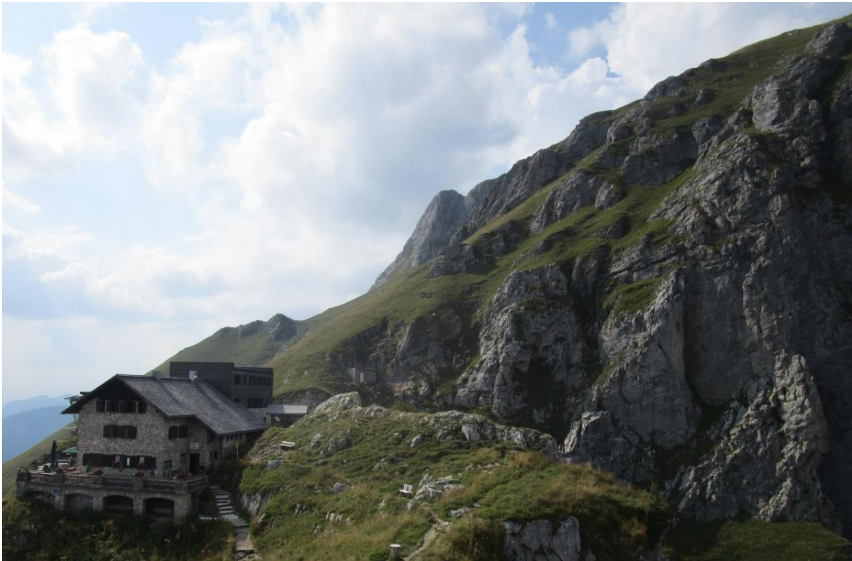
Die Bad Kissinger Hütte unterhalb des Aggensteins.

14:30 Uhr bis 16:00 Uhr: Aufenthalt in der Bad Kissinger Hütte (bewirtschaftet; Höhenlage: 1792 m)