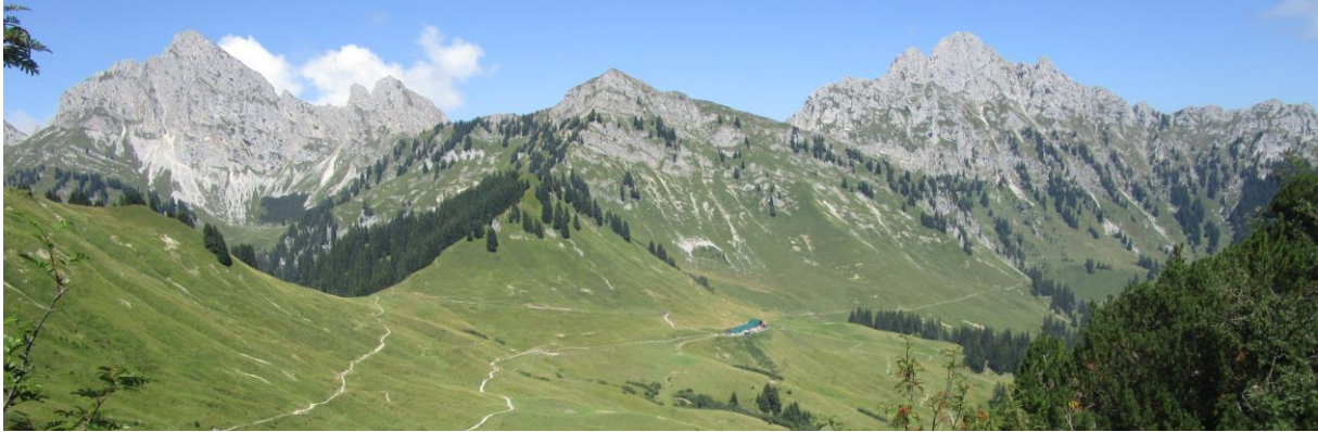
Die Lechaschauer Alm vor schöner Bergkulisse, bestehend aus Köllenspitze, Kelleschrofen, Schneid und Gehrenspitze (vlnr).