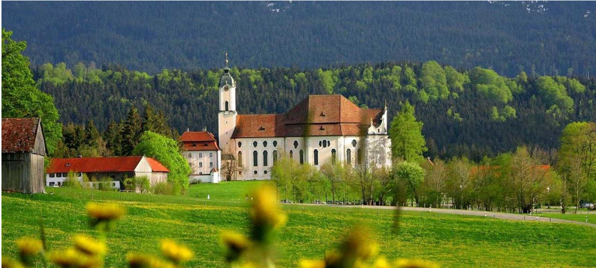
Die Wieskirche, ein Juwel des Rokoko, inmitten fruchtbarster Voralpenlandschaft

12:30-13:30 Uhr: Mittag im Gasthof Moser (Wies 1, D-86989 Steingaden)