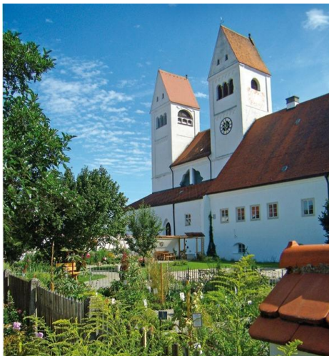
Das Steingadener Münster gehörte zu einem früheren Prämonstratenser-Kloster, das 1147 von Markgraf Welf VI. gegründet wurde.

15:15-16:30 Uhr: Rückwanderung auf anderem Weg (ca. 5 km) zum Gasthof Moser bei der Wieskirche