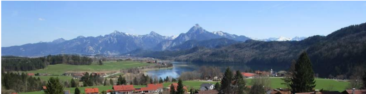
Der Königswinkel: Im Hintergrund das Ammergebirge, im Vordergrund der Weißensee.

Mein fünftes Freizeittreffen vom 28.-30. Juli 2023 richtet sich in erster Linie, aber nicht ausschließlich, an katholische Singles, die partnersuchend sind oder aber vielleicht auch nur ein schönes Wochenende in Gemeinschaft unter Gleichgesinnten miteinander verbringen möchten.