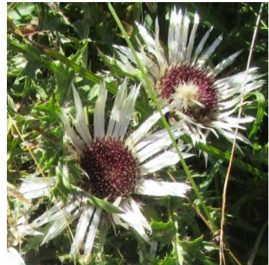
Dort in der Gegend kann man Mannstreu (li) finden 😊, mit viel Glück auch Prachtnelken (Mi) und häufig Silberdisteln (re).

18:00-20:00 Uhr: Abendessen (3 Gänge) im Restaurant des „Hotel Bannwaldsee“